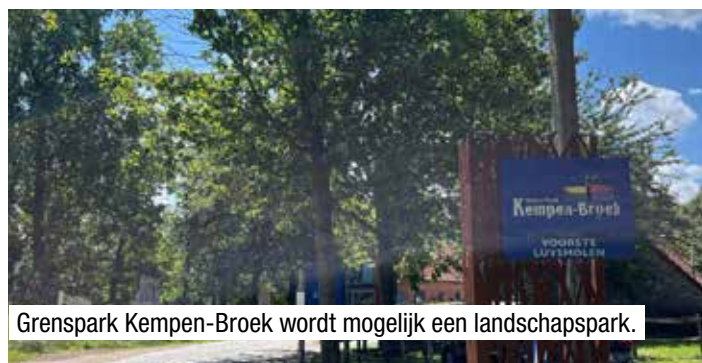
Grenspark Kempen-Broek wordt mogelijk een landschapspark.

In juni kreeg Kempen-Broek samen met RivierPark Maasvallei al 1,5 miljoen euro aan Europese subsidies om de parken bekender en aantrekkelijker te maken voor toeristen. Voor Kempen-Broek houdt dat in dat het wandelnetwerk wordt uitgebreid met rustplekken en watertappunten voor wandelaars en fietsers. Ook zal er werk gemaakt worden van een betere verbinding met de dorpskernen en de plaatselijke horeca en handelaars.